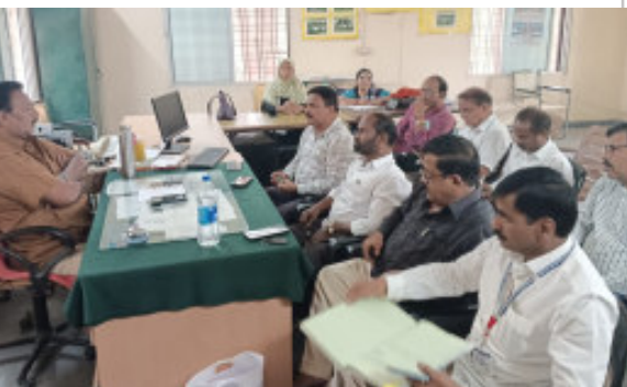
ఎప్పటి తరగతులు కూడా నిర్వహించాలని ఆదేశించారు. ప్రతి విద్యార్థి పై ప్రత్యేక శుద్ధ వహిస్తూ కళాశాలలో విద్యార్థుల హాజరు శాతాన్ని పెంచాలని దానికి తగిన చర్యలు తీసుకోవాలని ప్రిన్సిపాల్ లను ఆదేశించారు. పిల్లలకు ఆర్థం కానీ సబ్సిడీలో పదే పదే జోధించి, పరీక్షలు నిర్వహించి వారి భవిష్యత్ ను తీర్చి దిద్దాలని అన్నారు. ప్రతి విద్యార్థి యొక్క హాజరు వట్టి కను నిర్వహించడంతోపాటు మార్కులను ప్రతి సబ్సిడీలో పరిశీలించాలని అన్నారు.ఈ సమావేశంలో జిల్లాలోని అన్ని ప్రభుత్వ జూనియర్ కళాశాలలో ప్రిన్సిపాల్ పాల్గొన్నారు.