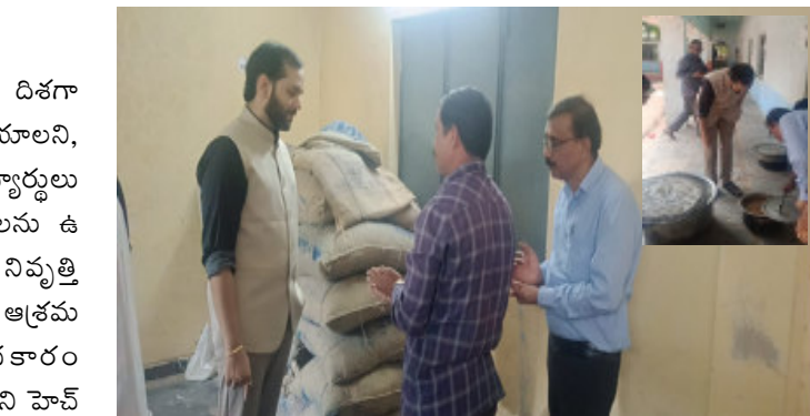
ఉత్తమ ఫలితాలు సాధించే దిశగా ఉపాధ్యాయులు కృషి చేయాలని, ప్రత్యేక తరగతులలో విద్యార్థులు తమకు కలిగిన సందేహాలను ఉపాధ్యాయులను అడిగి నివృత్తి చేసుకోవాలని తెలిపారు. ఆశ్రమ పాఠశాలలో మెసా ప్రకారం మధ్యాహ్న భోజనం పెట్టెలదైన హెచ్ ఎం మీద అదనపు కలెక్టర్ అగ్రం వ్యక్తం చేశారు. మరల పునరావేశం కాకుండా చూడాలని ఆదేశించారు. మరియు హెచ్.ఎమ్, కి కంప్లెక్స్ హెచ్ ఎమ్ కి షోకాజ్ నోటీసు ఇవ్వడం జరిగింది. అనంతరం గోలేటి గ్రామంలో కొనసాగుతున్న ఇందిరమ్మ ఇండ్ల నర్సే ప్రక్రియను