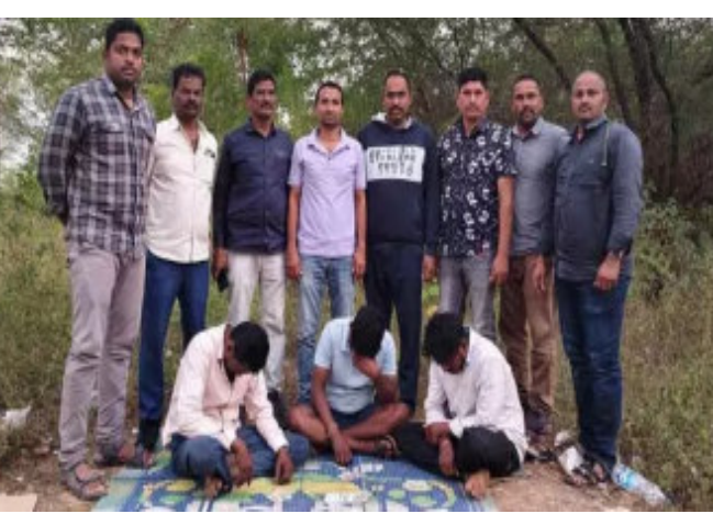
ఫరర్ అయ్యారు. విచారణ నిమిత్తం అరెస్ట్ అయిన నిందితులను కాసిపేట పోలీసులకు అప్పగించినట్లు టాస్క్ ఫోర్స్ పోలీసులు తెలిపారు.